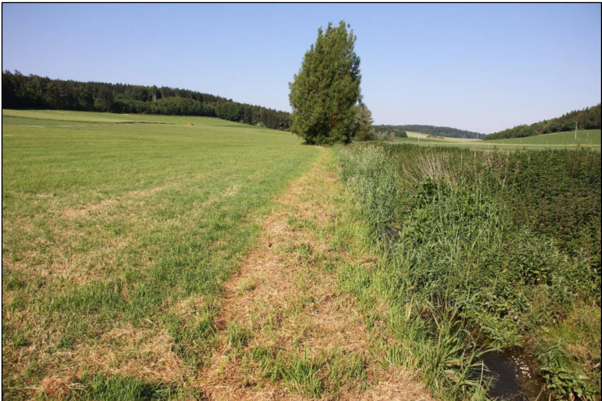
Abbildung 5: Der „Westenbrunnenbach“ wird im Vorhabensumfeld lediglich abschnittsweise durch nitrophile Stauden oder Solitärweiden beschattet.