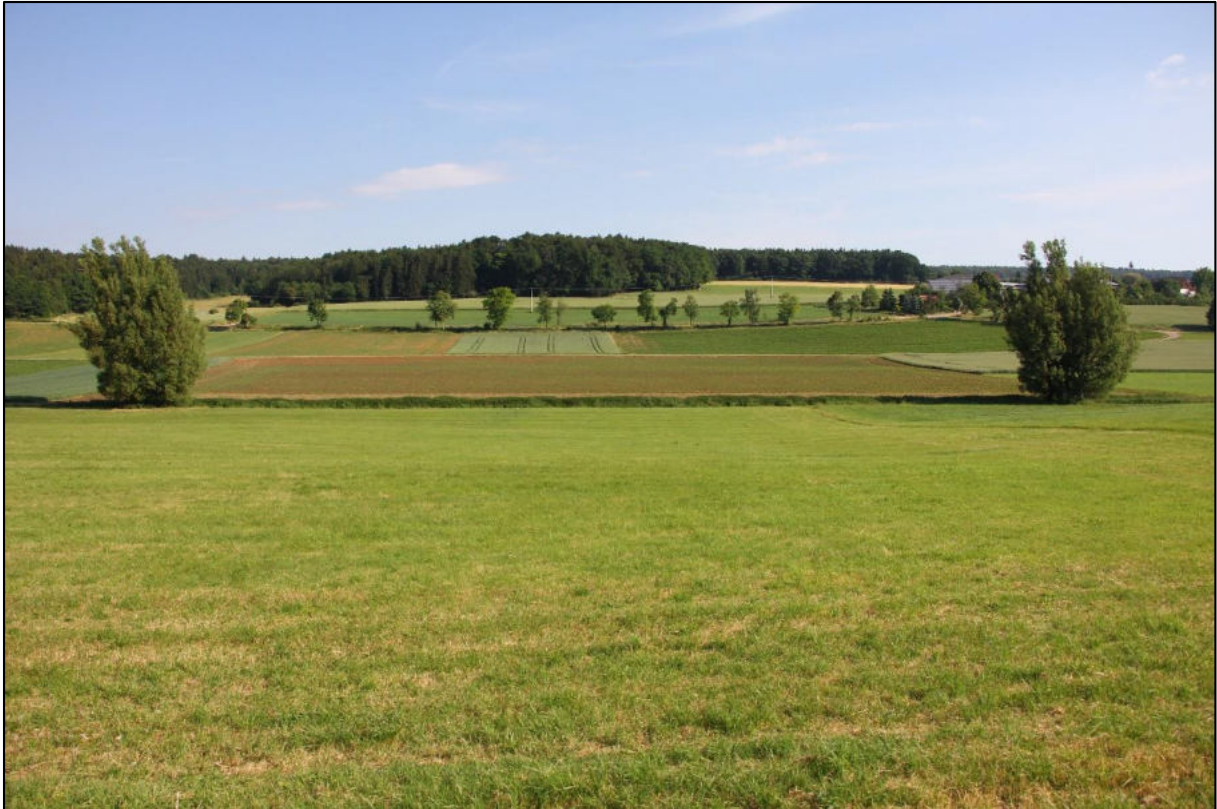
Abbildung 4: Bei der Vorhabensfläche handelt es sich um eine konventionell bewirtschaftete Mähwiese. Blickrichtung Nord.