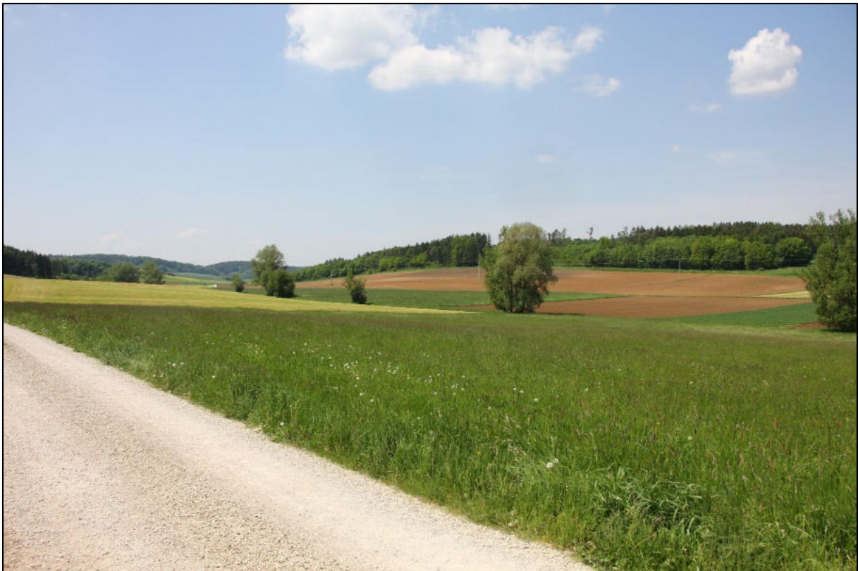
Abbildung 3: Die Planungsfläche befindet sich im vorwiegend grünlanddominierten Bachgrund des „Westenbrunnenbachs“ zwischen Wolferstadt und der Brenneisenmühle.

Methodisches Vorgehen und Begriffsabgrenzungen der nachfolgenden Untersuchung stützen sich auf die mit Schreiben des Bayerischen Staatsministeriums für Wohnen, Bau und Verkehr vom 20. August 2018 Az.: G7-4021.1-2-3 eingeführten „Hinweise zur Aufstellung naturschutzfachlicher Angaben zur speziellen artenschutzrechtlichen Prüfung in der Straßenplanung (saP)“ mit Stand 08/2018.